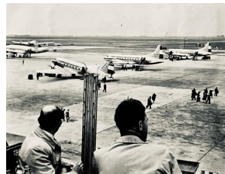
Schiphol begin jaren '50