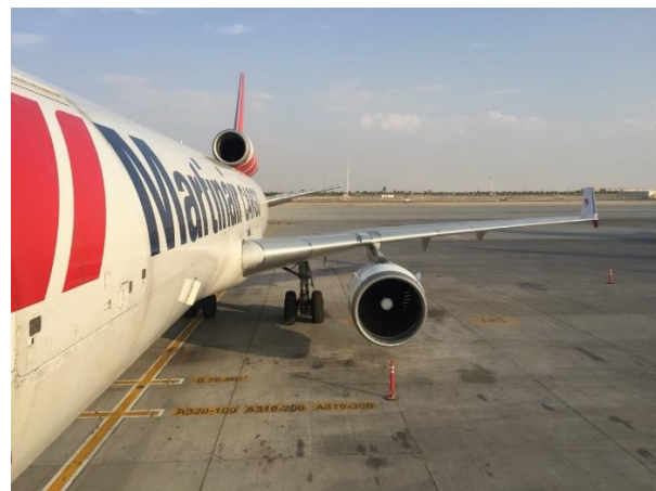
Martinair Cargo

Marc Dierikx: "Er gebeurde van alles, maar het mooiste voorbeeld was wel Taiwan. Begin jaren '80 na tientallen jaren onderhandeld te hebben met Peking over landingsrechten in de Volksrepubliek besepte men dat dit alles eigenlijk niets had opgeleverd. Misschien moesten de bakens worden verzet? KLM wilde graag als eerste maatschappij uit Europa een verbinding naar Taiwan gaan exploiteren. Het instrument hiervoor was Martinair. Als private onderneming vloog Martinair charters naar Taipei.