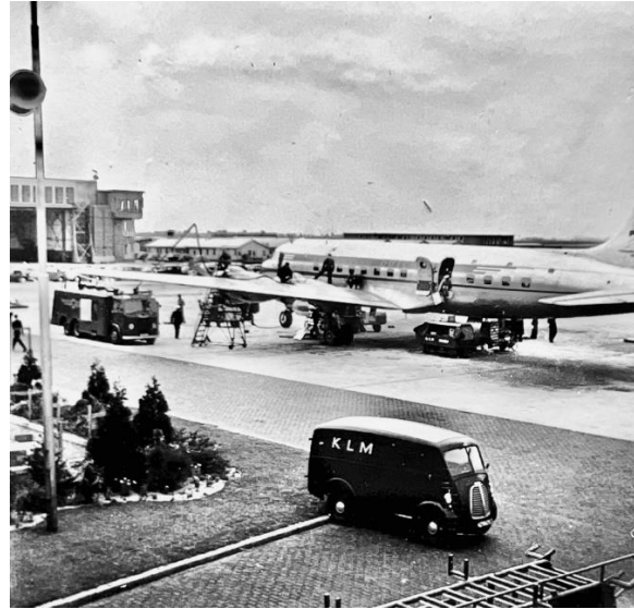
Het 'oude' Schiphol