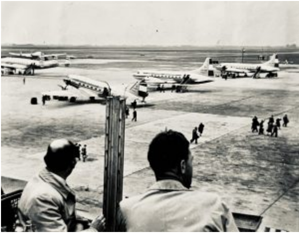
Schiphol begin jaren '50