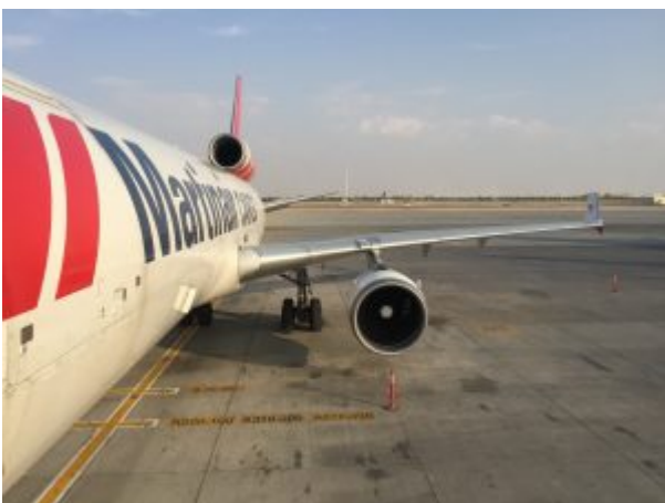
Martinair Cargo