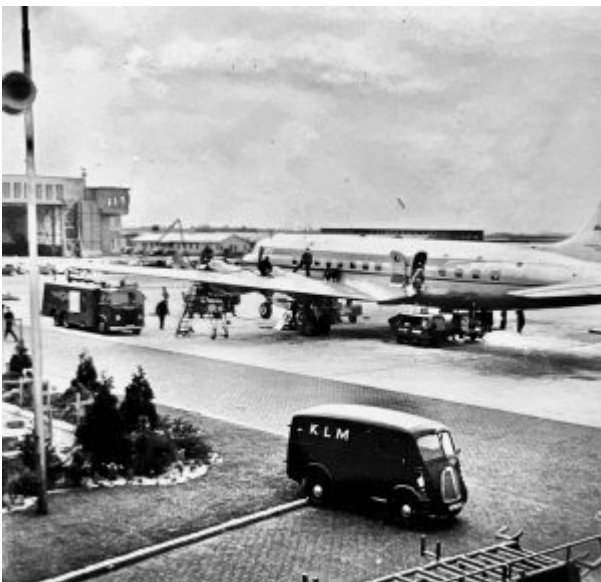
Het 'oude' Schiphol