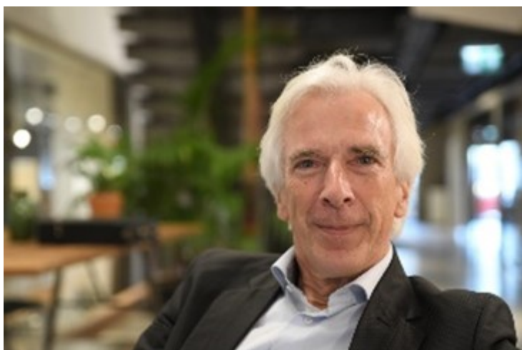
Auteur: Drs. Marc Smeulers